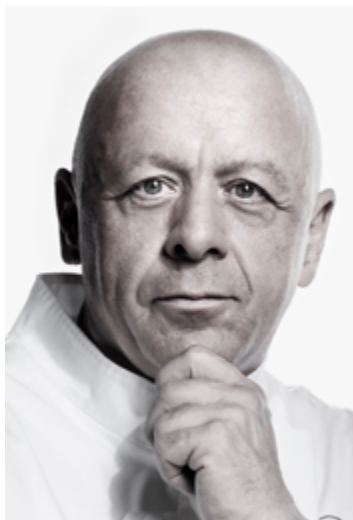
Thierry Marx chef étoilé, président de l'Umih